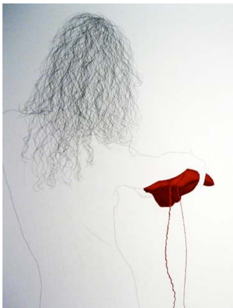
Cuerpo desorganizado (fragmento) Montse Carreño Dibujo digital sobre papel archival