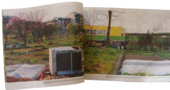
Huertos ilegales, 2002.