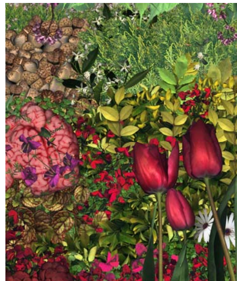
El jardí de les depulles, 2002

Su obra ha sido presentada en diversas exposiciones colectivas en Londres (London Print Studio), Dakar (Off Dak'art), Barcelona (CCCB, CASM, MACBA, Centro de Arte Santa Mónica, Galería Ferrán Cano), Madrid (Arco 2002), Reikjavík (Icelandic Collage of Arts and Crafts), Munich (Steindruck Müncher Künstlerhaus), Berlin (Hochschule der Kunst) e individuales, en Palma de Mallorca (Espai Zero, Fundació Pilar i Joan Miró).