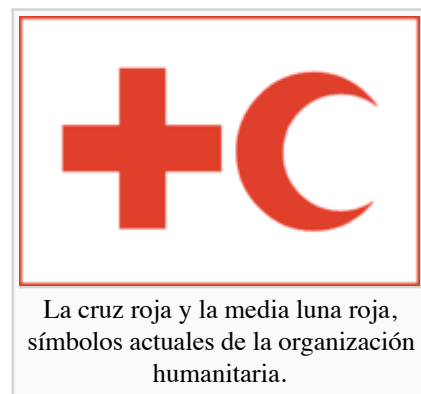
La cruz roja y la media luna roja, símbolos actuales de la organización humanitaria.