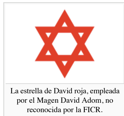
La estrella de David roja, empleada por el Magen David Adom, no reconocida por la FICR.